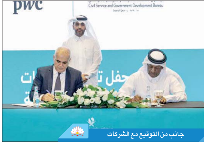
جانب من التوقيع مع الشركات