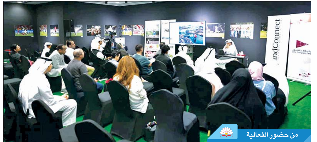
من حضور الفعالية