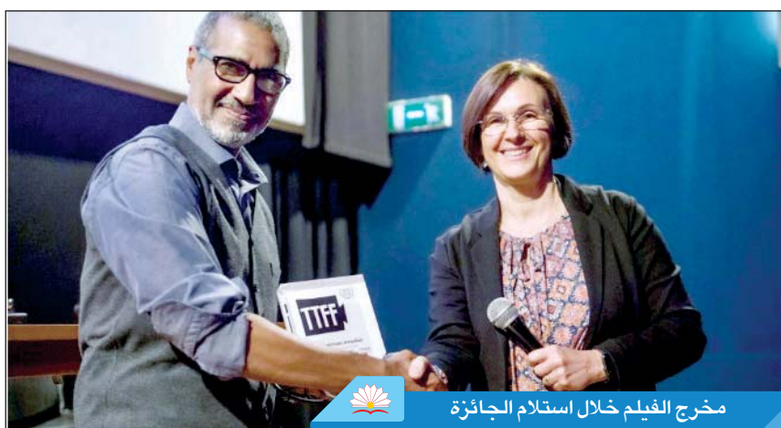
مخرج الفيلم خلال استلام الجائزة