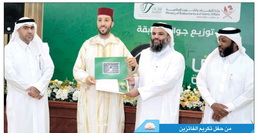
من حفل تكريم الفائزين