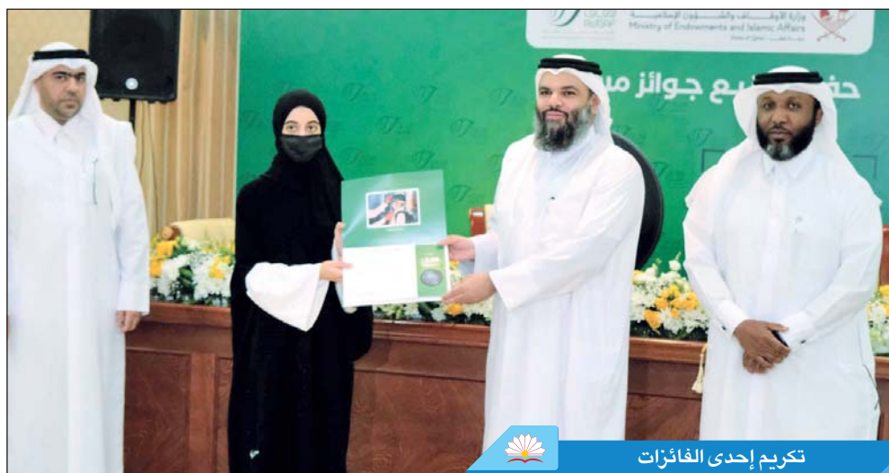
تكريم إحدى الفائزات