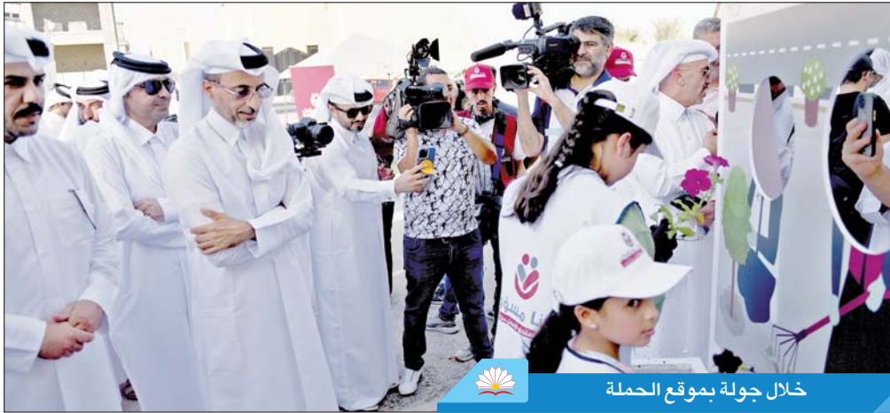
خلال جولة بموقع الحملة