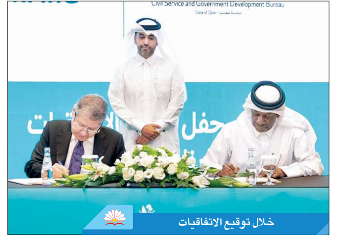
خلال توقيع الاتفاقيات