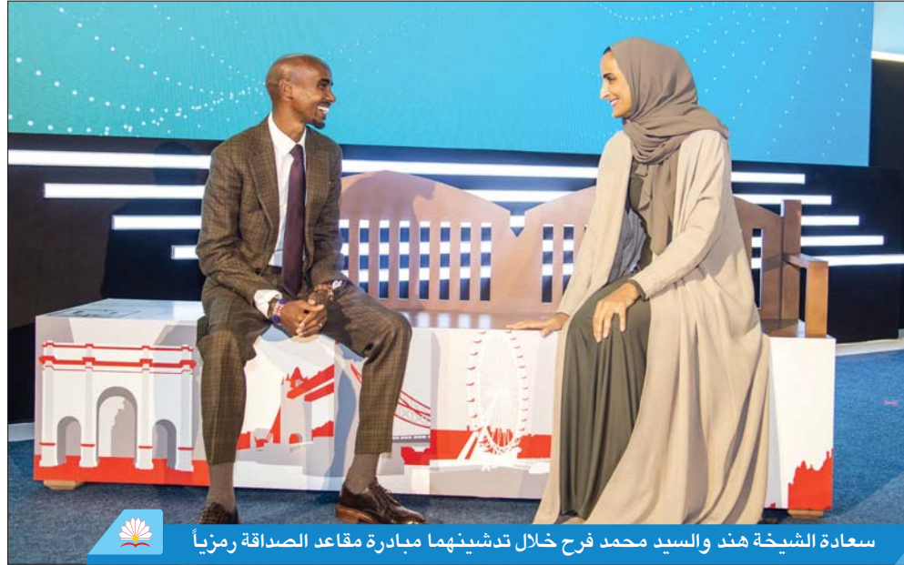
سعادة الشبيخة هند والسيد محمد فرح خلال تدشينهما مبادرة مقاعد الصداقة رمزياً

كأس العالم لكرة القدم المقبلة في دولة قطر - البطولة الأولى التي تقام في الشرق الأوسط والعالم العربي، والإرث الذي تعمل منظمة الصحة العالمية ووزارة الصحة العامة على تحقيقه. وأضافت إن الصحة النفسية تعد عنصراً أساسياً في الشراكة، وإن الهدف من توفير مقاعد الصداقة هو إيجاد مكان للمقيمين والزوار في قطر، أثناء وبعد بطولة كأس العالم لكرة القدم، للالتقاء وسؤال بعضهم البعض «هل أنت بخير؟» وإظهار دعمهم للصحة النفسية.