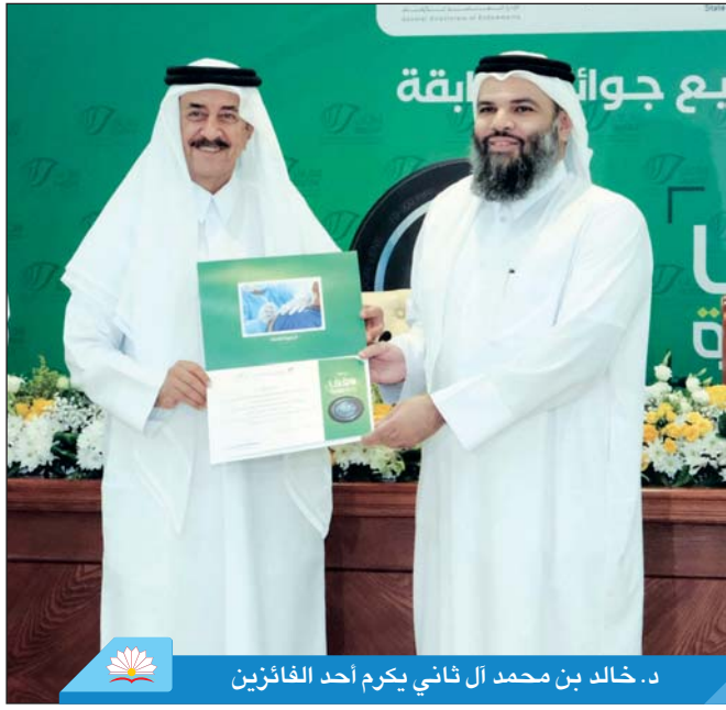
د. خالد بن محمد آل ثاني يكرم أحد الفائزين