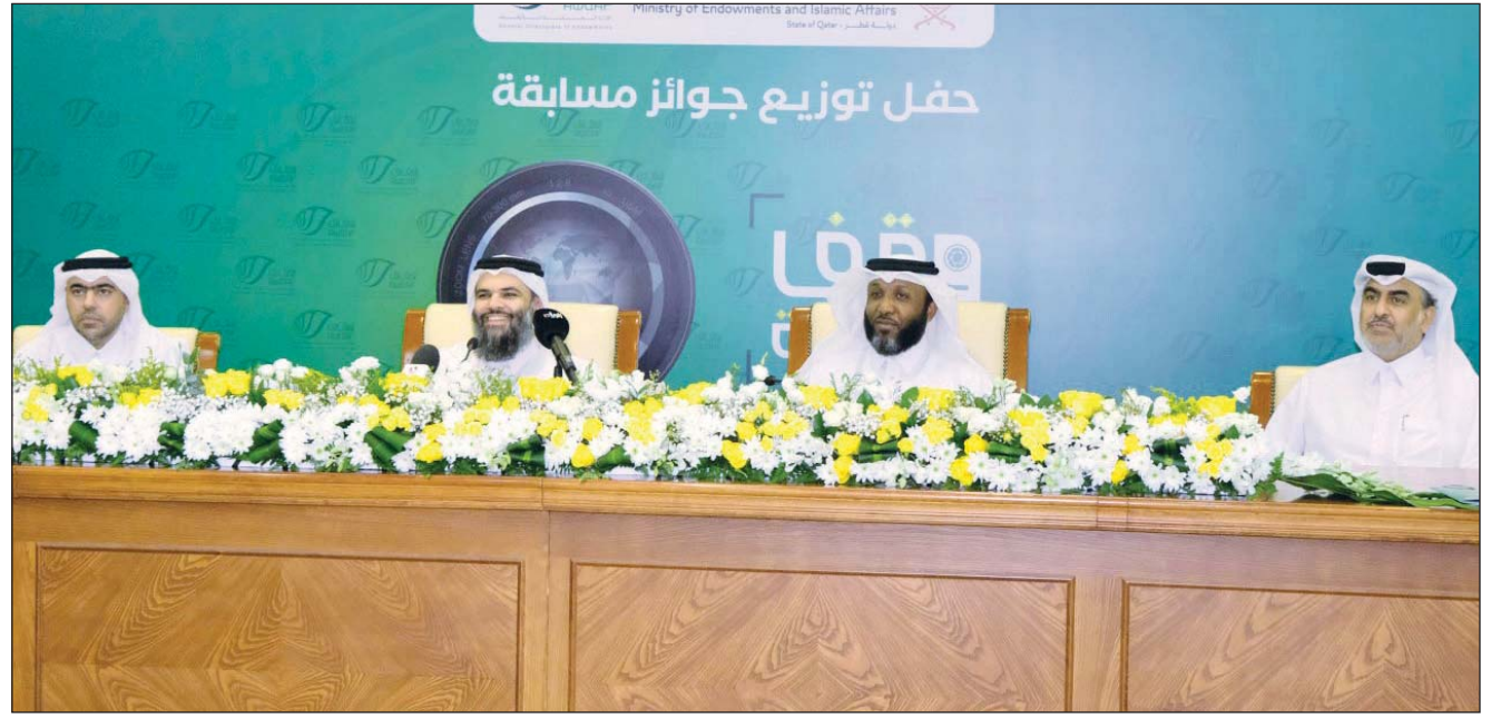
حفل توزيع جوائز مسابقة

المسابقة تتبنى كل عام مواضيع جديدة ترتبط بالعمل الوقفي