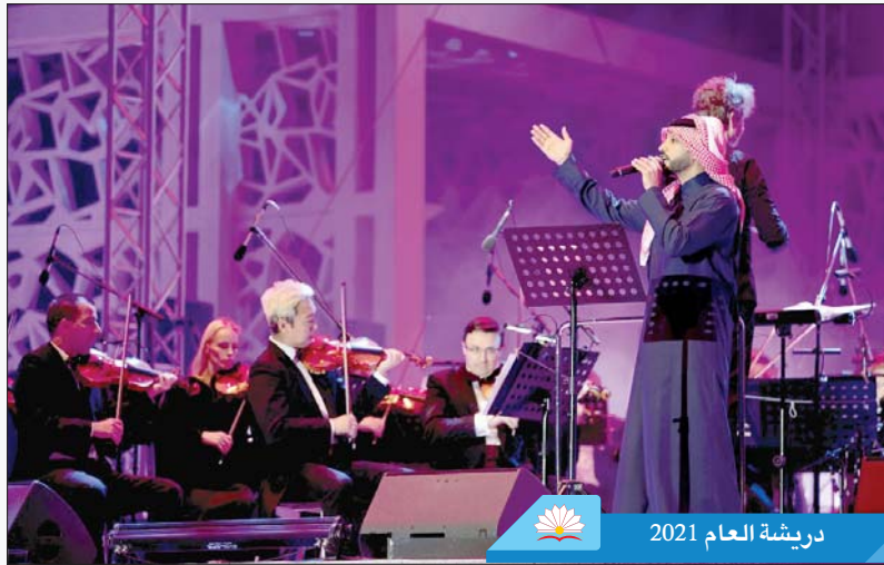
دريشة العام 2021

وهناك برنامج لكل القدرات، وهو مبادرة تدعم أفراد المجتمع من ذوي القدرات المختلفة للانخراط في أنشطة رياضية وتنموية، وإتاحة الفرص لأفراد المجتمع لدعم البرنامج عن طريق التطوع، ويتضمن البرنامج مخيمات متخصصة، وفصولاً لكرة القدم والسباحة توائم الاحتياجات الفردية للأفراد المشتركين.