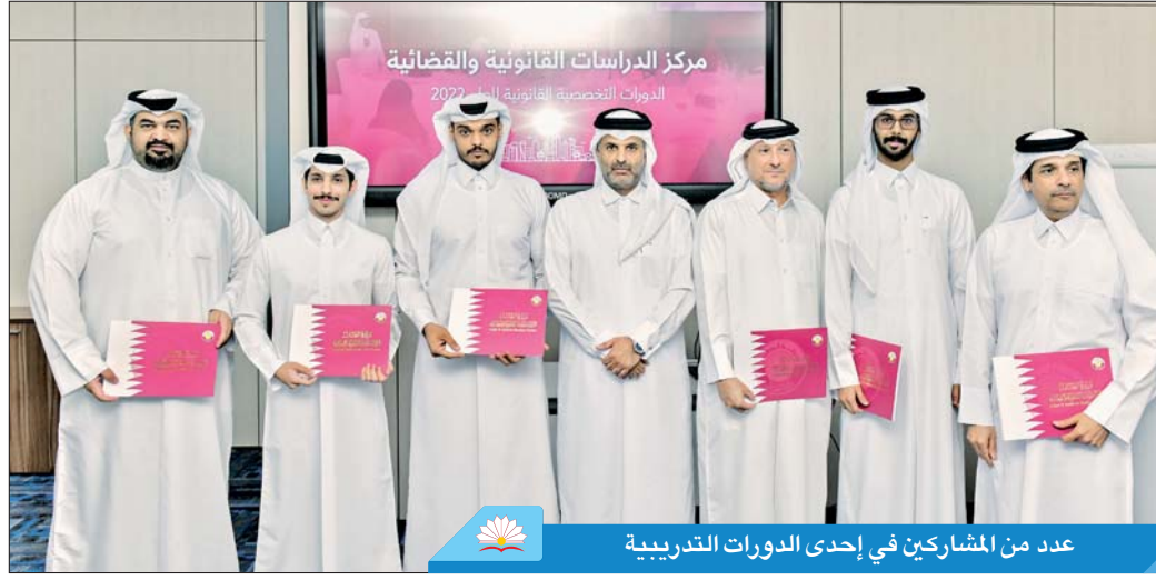
عدد من المشاركين في إحدى الدورات التدريبية

واستهدفت الدورة التدريبية الثالثة التي تم تنظيمها بعنوان «اتفاق التحكيم (ضوابطه - قواعد