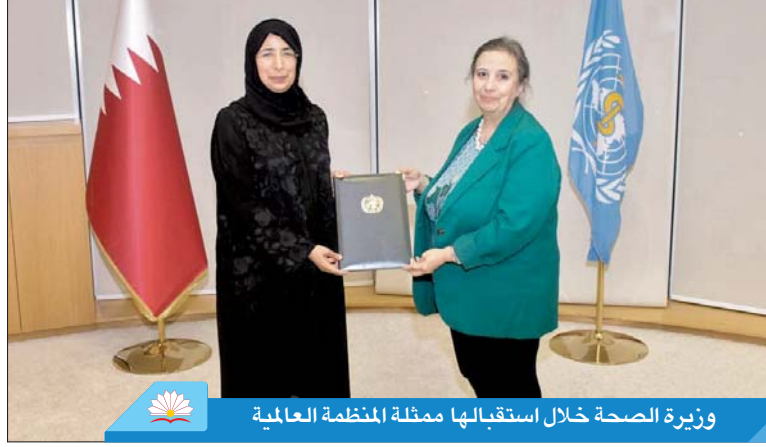
وزيرة الصحة خلال استقبالها ممثلة المنظمة العالمية

تشارك دولة قطر في اجتماعات الدورة التاسعة والستين للجنة الإقليمية لمنظمة الصحة العالمية لشرق المتوسط، والتي بدأت أمس في القاهرة وتستمر أربعة أيام، وتعد الاجتماعات بطريقة مختلطة تجمع بين الحضور الشخصي والمشاركة عبر الإنترنت. يترأس وفد دولة قطر في الاجتماعات سعادة الدكتورة حنان محمد الكواري، وزيرة الصحة العامة، وذلك من خلال تقنية الاتصال عن بُعد.