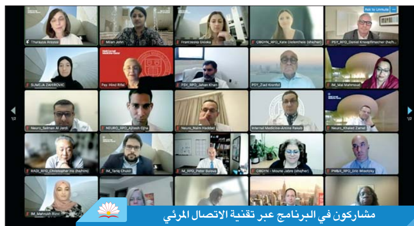
مشاركون في البرنامج عبر تقنية الاتصال المرئي

تواصل طلاب وأعضاء هيئة التدريس في وايل كورنيل للطب - قطر مع أكاديميين يمثلون نخبة من أبرز المؤسسات الطبية الأمريكية، وذلك في إطار برنامج الأساتذة الزائرين، الذي توافقه الكلية على تنظيمه سنوياً منذ عام 2013. ويهدف هذا البرنامج للتعريف بالكلية في أوساط برامج إقامة الأطباء المرموقة والقائمين عليها ككلية طب نخوية تخرّج أطباء علماء مؤهلين بمعايير رفيعة للالتحاق بأبرز برامج إقامة الأطباء داخل دولة قطر عبر بوابة مؤسسة حمد الطبية وأيضاً في أهم المؤسسات الطبية العالمية. ويتعدّد هذا البرنامج المتمحور حول طلاب الكلية على مدار يومين عبر منصة افتراضية، ويتيح للطلاب فرصة استكشاف خيارات المهن الطبية المتعددة والاستفسار من الأساتذة الزائرين عن أصول تقديم طلبات الالتحاق ببرامج إقامة الأطباء وسبل التحضير