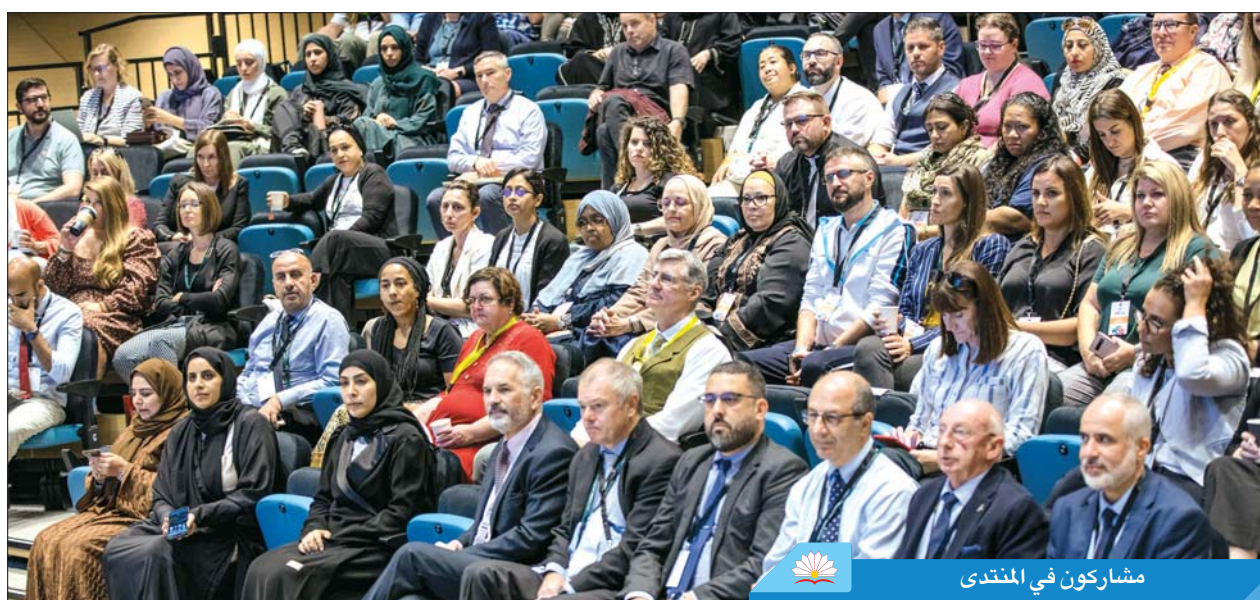
مشاركون في المنتدى

وأضاف: «تتغير الأمور باستمرار، هناك تقنيات ومهارات جديدة في عالم التعليم كل يوم، وهنا تكمن أهمية تنظيم هذا المنتدى، لاكتساب وتطوير مهارات جديدة، والحفاظ عليها حتى نتمكن من إفادة طلابنا ومجتمعنا».