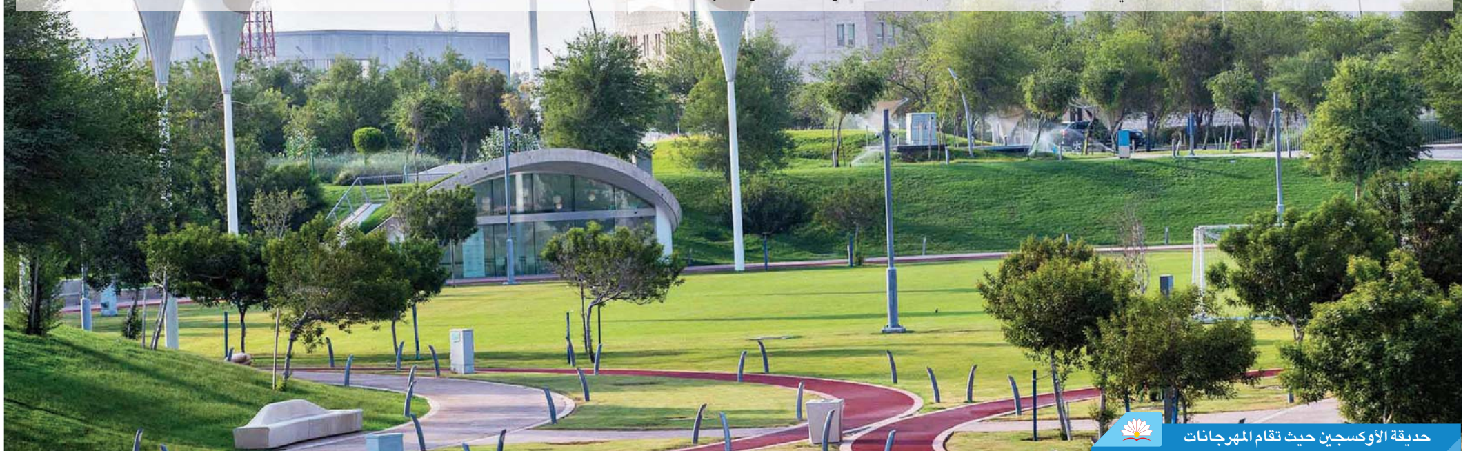
حديقة الأوكسجين حيث تقام المهرجانات

وترحب الفعاليات بالجميع، وهي تحمل أهدافاً عديدة أبرزها التنوع الثقافي والتعليمي والترفيهي والرياضي، وتركز بالدرجة الأولى على إبراز الوجه التراثي والحضاري للدولة، وللتعريف بدور مؤسسة قطر في الثقافة والتعليم.